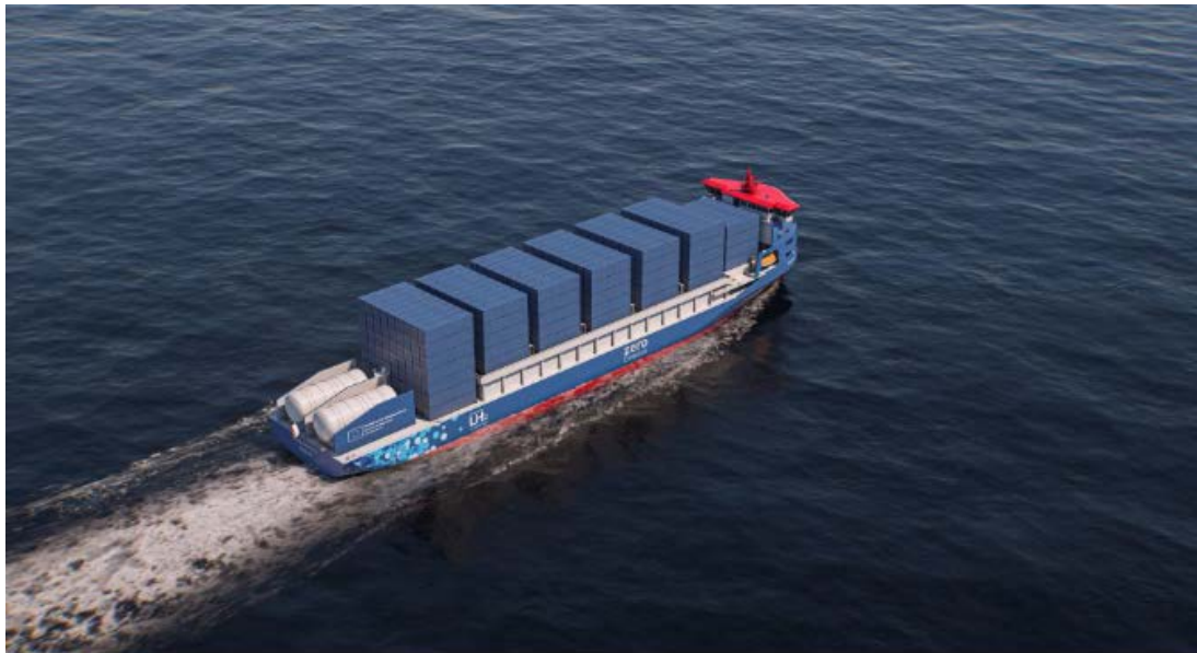
Energy Observer 2

Energy Observer Concept a remporté le soutien du Fonds pour l'innovation de l'Union européenne pour son projet de cargo à hydrogène liquide : Energy Observer 2 | EO2